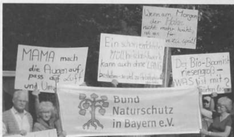
Zu Beginn des Erörterungstermins demonstrierte der BN gegen die geplante Müllverbrennungsanlage ...

Weder die Firma Lang noch das Landratsamt waren bereit, auf der Erörterung die wichtige Frage nach dem zukünftigen Betrei-