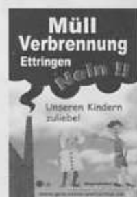
Plakat gegen die Müllverbrennung