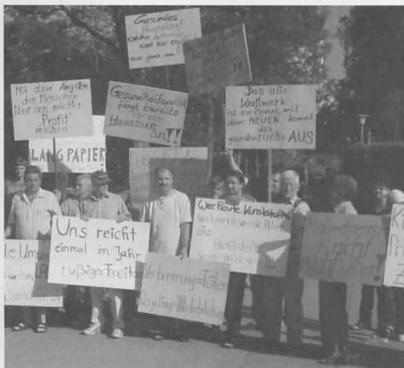
... zusammen mit der Bürgerinitiative „Gesundes Wertachtal e. V.“

ber der Anlage zu klären. Inzwischen hat die Firma Lang offiziell die Zusammenarbeit mit dem Entsorgungsunternehmen B+T bestätigt. Damit ist davon auszugehen, dass B+T, dessen Vertreter bei der Erörterung bereits in den Reihen der Firma Lang anwesend waren, auch der Betreiber sein wird.